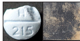
A xilazina foi encontrada em pó e comprimidos para dor.