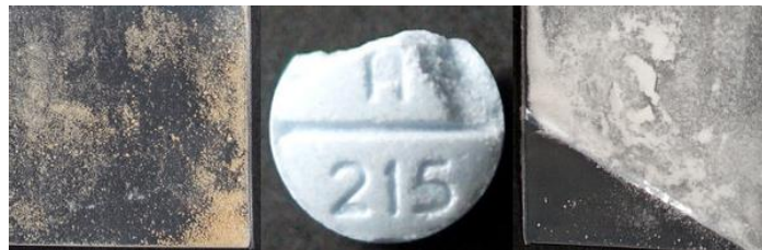
Xylazine đã được tìm thấy trong bột ma túy trên đường phố và trong các loại thuốc giảm đau giả.

Ngất đi do xylazine có thể giống như bị quá liều opioid, nhưng nó sẽ không tạo phản ứng khi sử dụng naloxone. Nếu có ai đó vẫn còn thở nhưng không tỉnh dậy khi bạn cố gắng đánh thức họ, hãy theo dõi hơi thở của họ nhằm đảm bảo họ vẫn đang có đủ khí oxy. Cho uống naloxone, bắt đầu cấp cứu hơi thở và gọi cấp cứu nếu họ thở gập hoặc da chuyển sắc xanh xao tái nhợt.