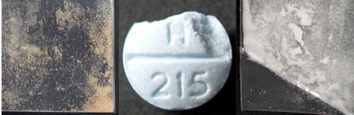
ពេលតែ មួយ។

ការងក់ក្បាលដែលកើតចេញពី ស៊ីលីហ្វីន អាចមើលទៅដូចជាការប្រើថ្នាំអាគ្រីនច្រើនពេក ប៉ុន្តែវាមិនមែនឆ្លើយតបទៅនឹង ណាឡូហ្សាន ទេ។ ប្រសិនបើនរណាម្នាក់កំពុងដកដង្ហើមប៉ុន្តែមិនឆ្លើយតបនៅពេល អ្នកព្យាយាមដាស់ពួកគេ សូមមើលដង្ហើមរបស់ពួកគេ ដើម្បីប្រាកដថាពួកគេទទួលបានអ្នកស៊ីសែនគ្រប់គ្រាន់។ ផ្តល់ថ្នាំ ណាឡូហ្សាន ដើម្បីចាប់ផ្តើមសង្គ្រោះការដកដង្ហើម និងអំពាវនាវរកជំនួយ ប្រសិនបើការដកដង្ហើមរបស់ពួកគេមានសភាពអាក្រក់ ឬស្លែក។