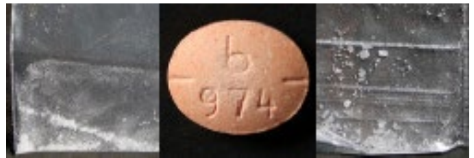
La metanfetamina puede aparecer en forma de cristales blancos, polvos blancos o pastillas prensadas.